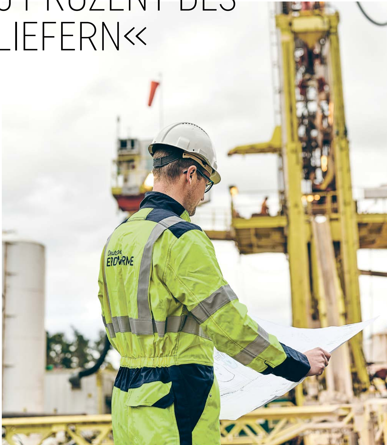
In Graben-Neudorf (Baden-Württemberg) wird ein Reservoir in fast vier Kilometern Tiefe angebohrt.

Außerdem benötigen wir Konzepte für den Hochlauf der Geothermie. Das heißt für die